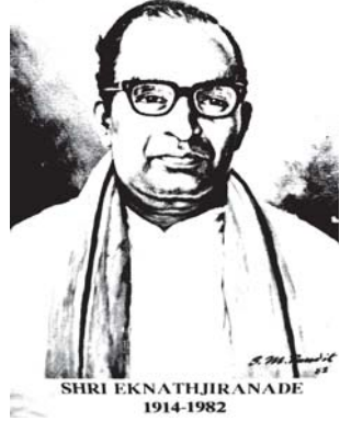
SHRI EKNATHJIRANAIDE 1914-1982

உங்கள் கடிதம் 14.10.1963 என்று தேதியிடப்பட்டிருந்தது. ஆனால் 16.10.1963 அன்று தபால் பெட்டியில் போடப்பட்டது. அது 17.10.1963 அன்று இங்கு வந்து சேர்ந்தது. நான் 15-ம் தேதியும், 16-ம் தேதியும் உங்கள் கடிதத்திற்காக வீணாகக் காத்து இருந்தேன்.